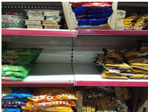
ANTES - PRATELEIRAS DESORGANIZADAS COM FALTA DE PRODUTOS DO ESTOQUE