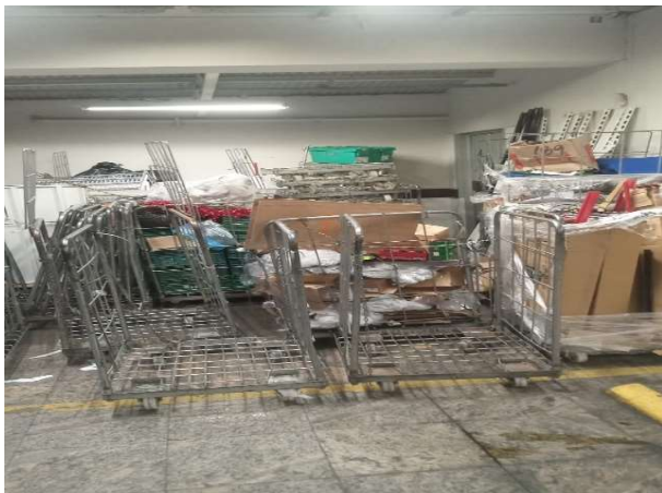
ANTES - ESTOQUE DESORGANIZADO COM PRODUTOS PERDIDOS DO CAMPO DE VISÃO