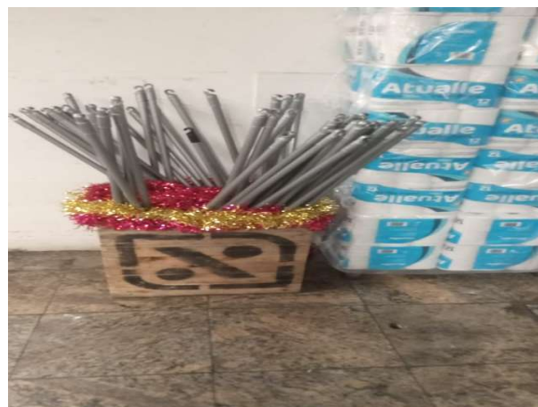
DEPOIS - RESERVA ORGANIZADA COM ESPAÇO E VISIBILIDADE DE PRODUTOS