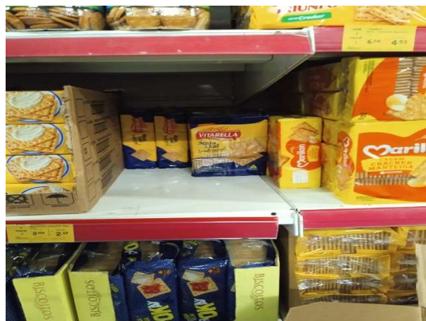
ANTES - PRATELEIRAS DESORGANIZADAS COM FALTA DE PRODUTOS DO ESTOQUE