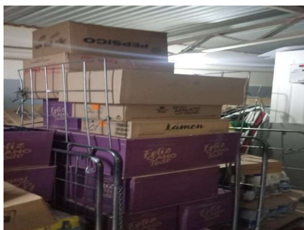
ANTES - ESTOQUE DESORGANIZADO COM PRODUTOS PERDIDOS DO CAMPO DE VISÃO