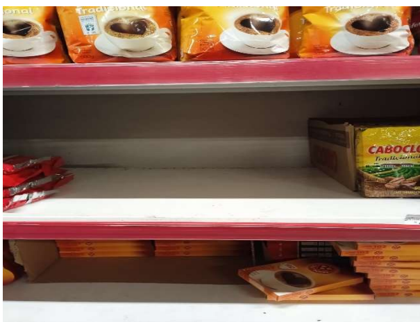
ANTES - PRATELEIRAS DESORGANIZADAS COM FALTA DE PRODUTOS DO ESTOQUE