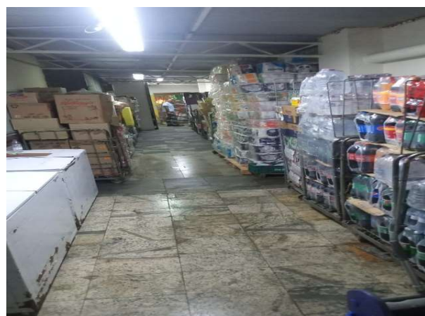
DEPOIS - RESERVA ORGANIZADA COM ESPAÇO E VISIBILIDADE DE PRODUTOS