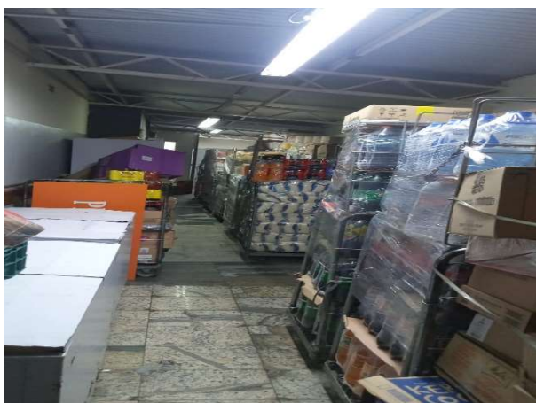
ANTES - ESTOQUE DESORGANIZADO COM PRODUTOS PERDIDOS DO CAMPO DE VISÃO