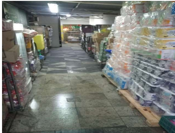
DEPOIS - RESERVA ORGANIZADA COM ESPAÇO E VISIBILIDADE DE PRODUTOS