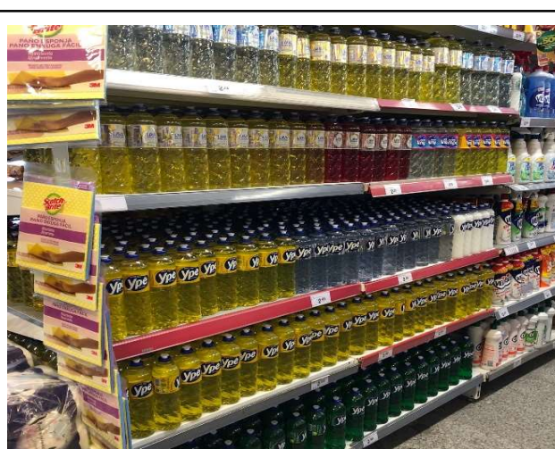
DEPOIS - PRATELEIRAS ORGANIZADAS COM PRODUTOS