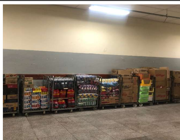
DEPOIS - ESTOQUE ORGANIZADO E COM TOTAL VISIBILIDADE DE PRODUTOS