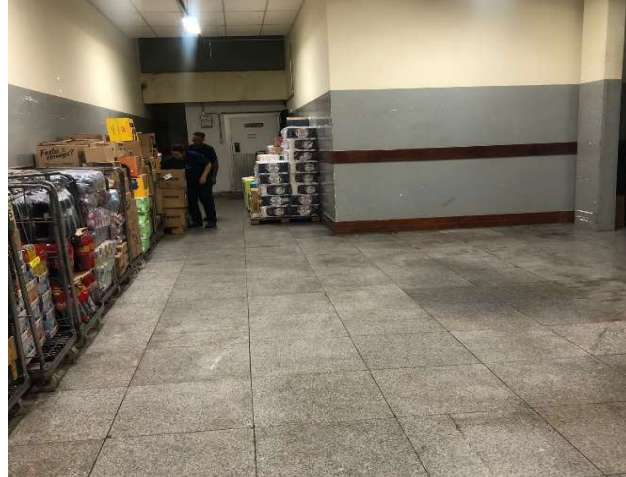
DEPOIS - ESTOQUE ORGANIZADO E COM TOTAL VISIBILIDADE DE PRODUTOS