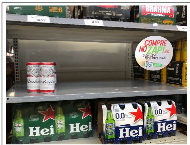
ANTES - PRATELEIRAS DESORGANIZADAS COM FALTA DE PRODUTOS