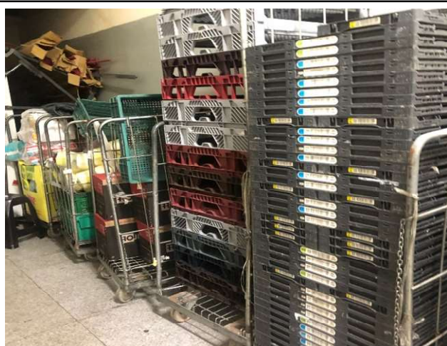
ANTES - ESTOQUE DESORGANIZADO COM PRODUTOS AGLOMERADOS E SEM VISIBILIDADE