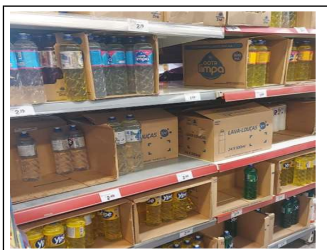
ANTES - PRATELEIRAS DESORGANIZADAS COM FALTA DE PRODUTOS