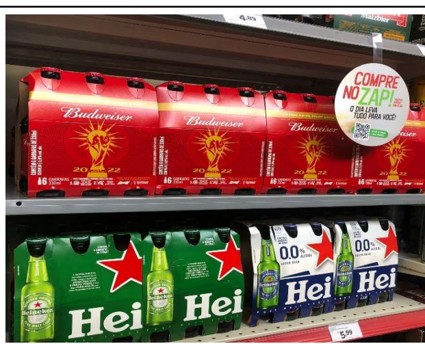
DEPOIS - PRATELEIRAS ORGANIZADAS COM PRODUTOS