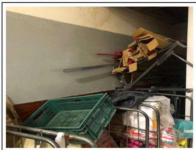
ANTES - ESTOQUE DESORGANIZADO COM PRODUTOS AGLOMERADOS E SEM ESPAÇO