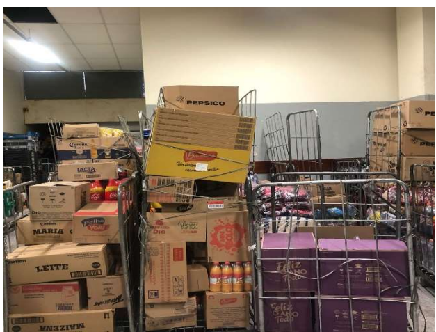
ANTES - ESTOQUE DESORGANIZADO COM PRODUTOS AGLOMERADOS E SEM VISIBILIDADE