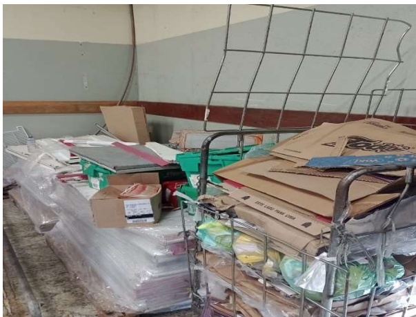
ANTES - RESERVA DESORGANIZADA COM PERDA DE ESPAÇO E VISIBILIDADE DE PRODUTOS