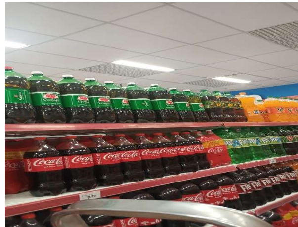
DEPOIS - PRATELEIRAS ORGANIZADAS COM PRODUTOS DO ESTOQUE