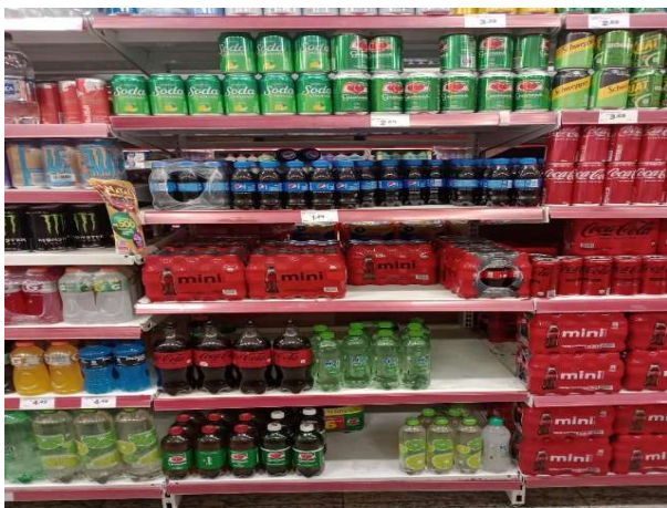
ANTES - PRATELEIRAS DESORGANIZADAS COM FALTA DE PRODUTOS DO ESTOQUE