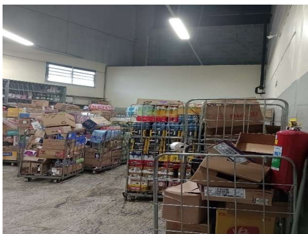
ANTES - RESERVA DESORGANIZADA COM PERDA DE ESPAÇO E VISIBILIDADE DE PRODUTOS