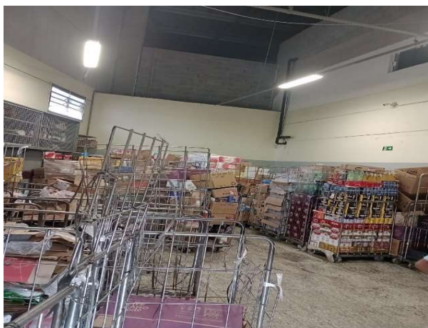
ANTES - RESERVA DESORGANIZADA COM PERDA DE ESPAÇO E VISIBILIDADE DE PRODUTOS