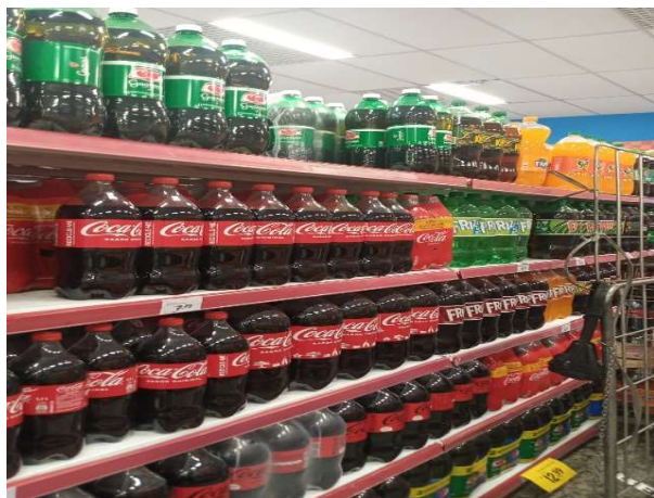
ANTES - PRATELEIRAS DESORGANIZADAS COM FALTA DE PRODUTOS DO ESTOQUE