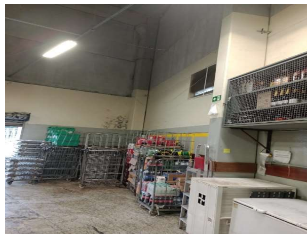
DEPOIS - ESTOQUE ORGANIZADO COM ESPAÇO E PRODUTOS VISÍVEIS