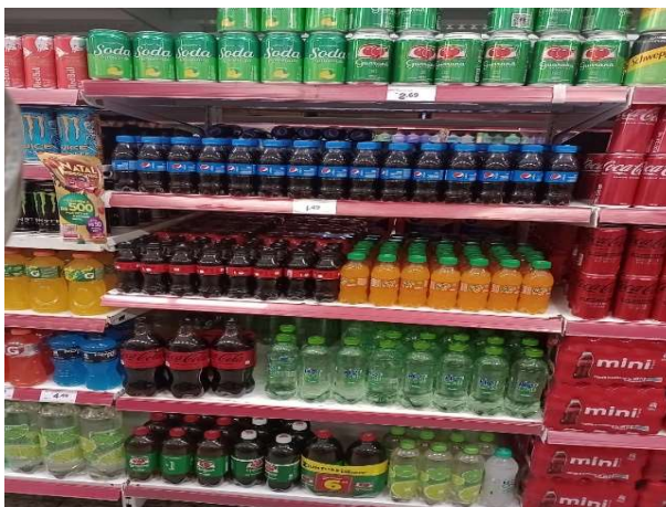
DEPOIS - PRATELEIRAS ORGANIZADAS COM PRODUTOS DO ESTOQUE