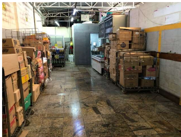
DEPOIS - ESTOQUE ORGANIZADO COM PRODUTOS VISIVEIS