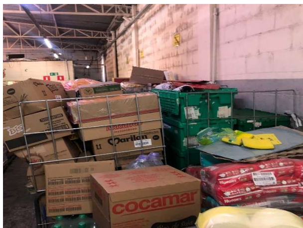
ANTES - ESTOQUE DESORGANIZADO COM PRODUTOS SEM VISIBILIDADE