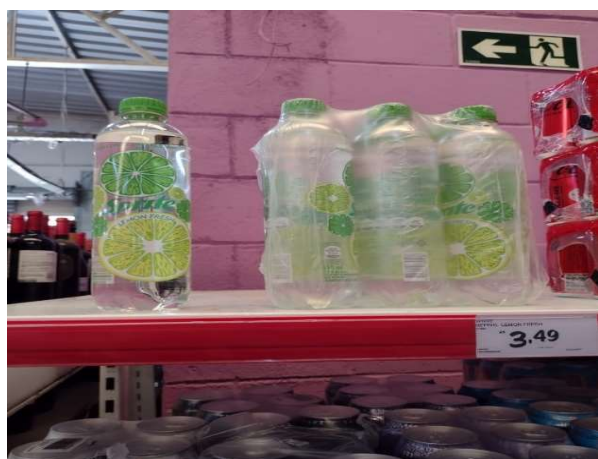
ANTES - PRATELEIRAS SEM PRODUTOS QUE ESTAVAM NO ESTOQUE