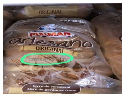
PRODUTOS VENCIDOS EM GRANDE QUANTIDADE