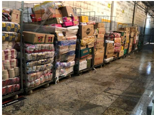
DEPOIS - ESTOQUE ORGANIZADO COM PRODUTOS VISIVEIS