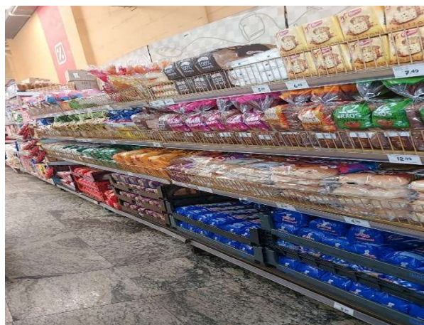
DEPOIS - PRATELEIRAS ORGANIZADAS COM PRODUTOS DO ESTOQUE