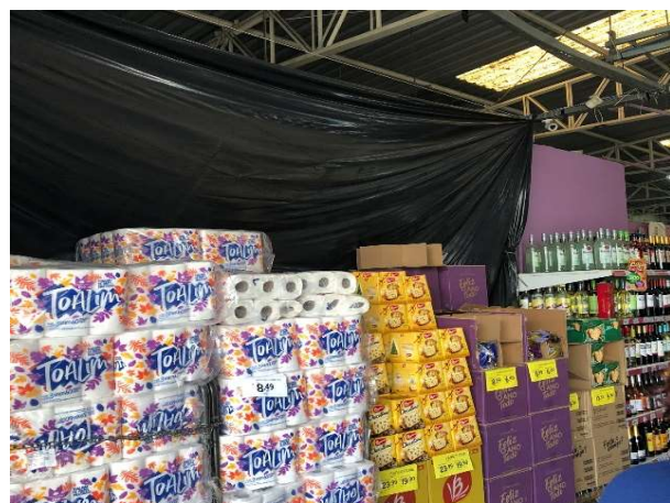
ANTES - ESPOSIÇÃO DE FRENTE DE LOJA DESORGANIZADA