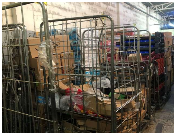
ANTES - ESTOQUE DESORGANIZADO COM PRODUTOS SEM VISIBILIDADE