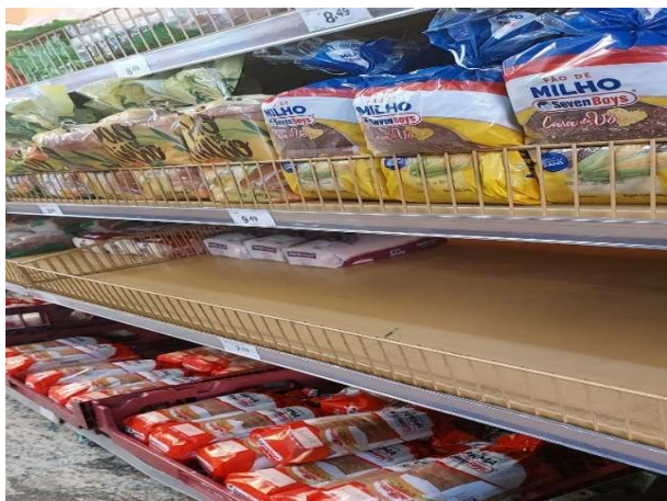
ANTES - PRATELEIRAS SEM PRODUTOS QUE ESTAVAM NO ESTOQUE