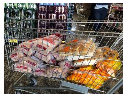
PRODUTOS VENCIDOS EM GRANDE QUANTIDADE