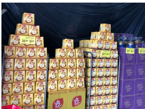
DEPOIS - ESPOSIÇÃO DE FRENTE DE LOJA ARRUMADA COM PRODUTOS DE ALTA DEMANDA DE NATAL PARA A DATA