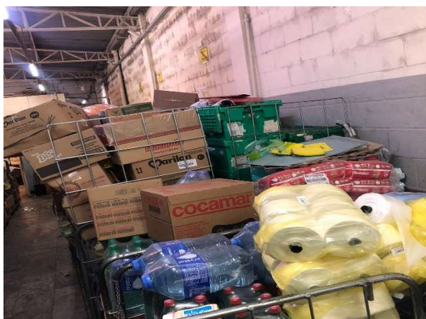
ANTES - ESTOQUE DESORGANIZADO COM PRODUTOS SEM VISIBILIDADE