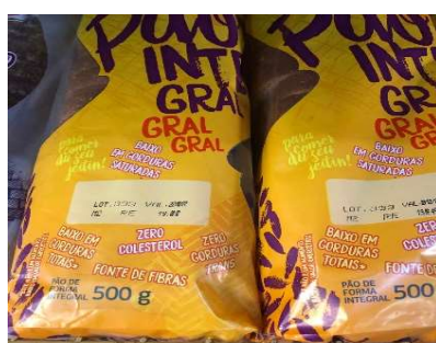
PRODUTOS VENCIDOS EM GRANDE QUANTIDADE