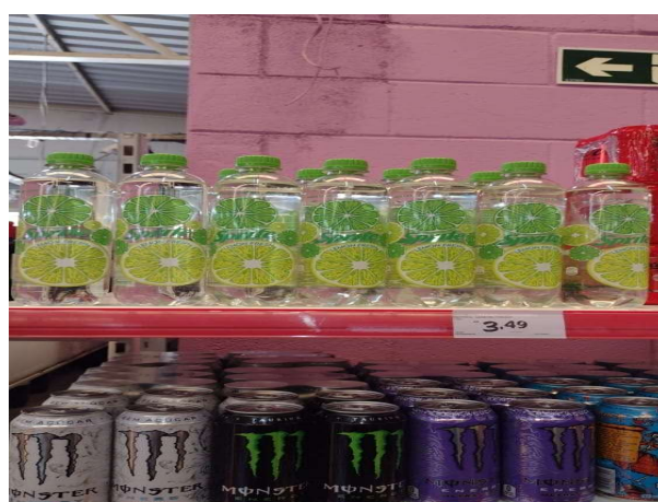
DEPOIS - PRATELEIRAS ORGANIZADAS COM PRODUTOS DO ESTOQUE