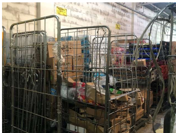
ANTES - ESTOQUE DESORGANIZADO COM PRODUTOS SEM VISIBILIDADE

No estoque encontramos grande quantidade de produtos que não estavam em prateleira, grande quantidade de produtos vencidos foram encontrados no estoque e em prateleira, as prateleiras e estoque foram organizados e revitalizados.