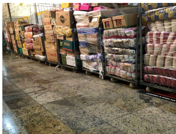
DEPOIS - ESTOQUE ORGANIZADO COM PRODUTOS VISIVEIS