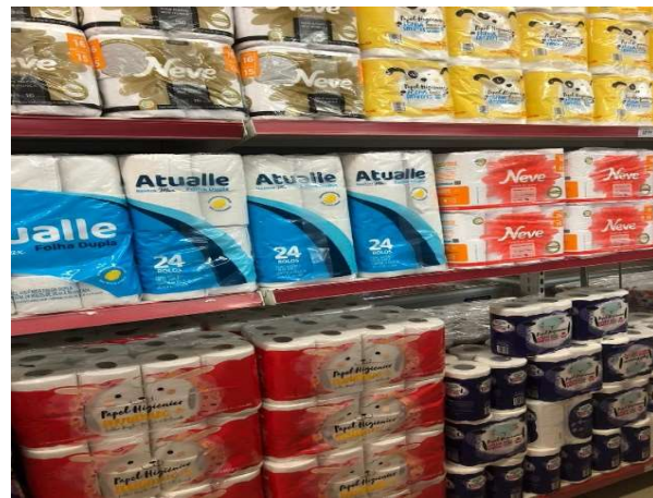
DEPOIS - PRATELEIRAS ORGANIZADAS COM PRODUTOS DO ESTOQUE