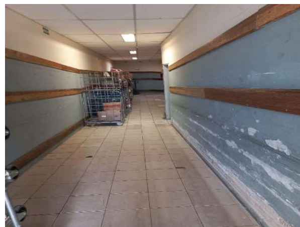
DEPOIS - ESTOQUE ORGANIZADO COM PRODUTOS VISIVEIS