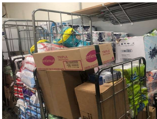
ANTES - ESTOQUE DESORGANIZADO COM PRODUTOS SEM VISIBILIDADE