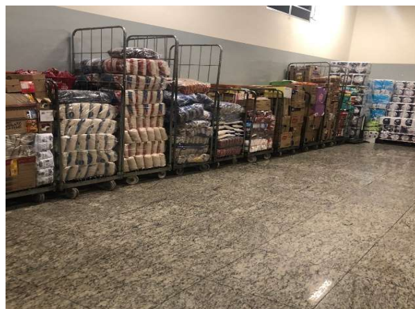
DEPOIS - ESTOQUE ORGANIZADO COM PRODUTOS VISIVEIS