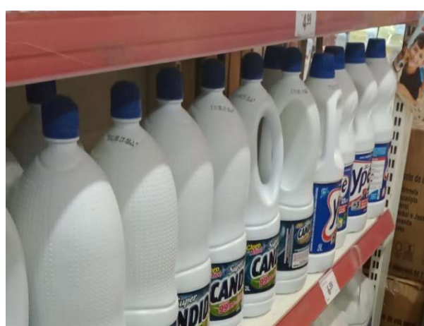
DEPOIS - PRATELEIRAS ORGANIZADAS COM PRODUTOS DO ESTOQUE