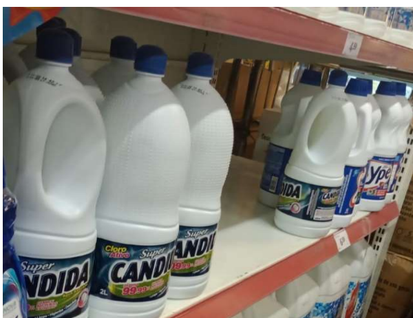
ANTES - PRATELEIRAS SEM PRODUTOS QUE ESTAVAM NO ESTOQUE