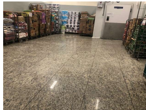
DEPOIS - ESTOQUE ORGANIZADO COM PRODUTOS VISIVEIS