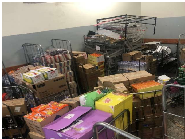
ANTES - ESTOQUE DESORGANIZADO COM PRODUTOS SEM VISIBILIDADE