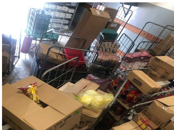
ANTES - ESTOQUE DESORGANIZADO COM PRODUTOS SEM VISIBILIDADE