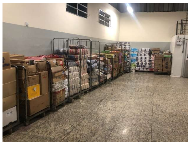
DEPOIS - ESTOQUE ORGANIZADO COM PRODUTOS VISIVEIS