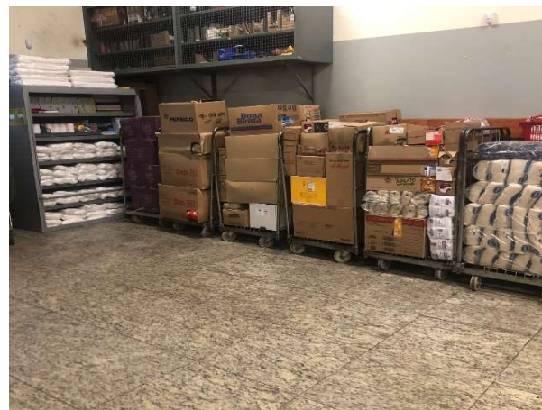
DEPOIS - ESTOQUE ORGANIZADO COM PRODUTOS VISIVEIS