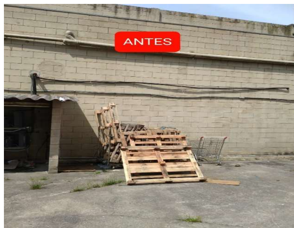
ANTES - PARTE EXTERNA DA LOJA DESORGANIZADA