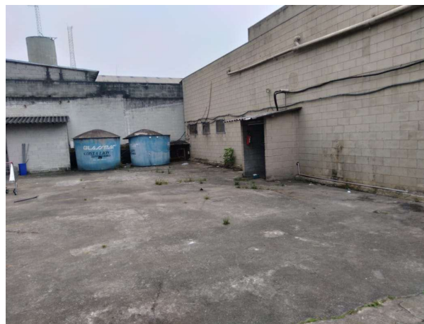
DEPOIS - PARTE EXTERNA DA LOJA ORGANIZADA