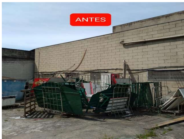
ANTES - PARTE EXTERNA DA LOJA DESORGANIZADA