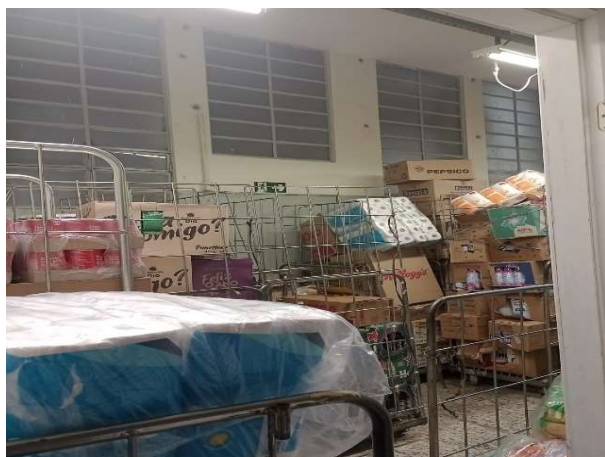
ANTES - RESERVA DESORGANIZADA COM PERDA DE ESPAÇO E VISIBILIDADE DE PRODUTOS