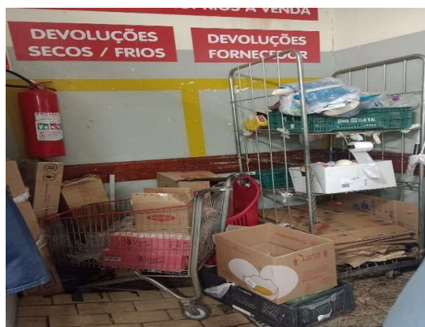
ANTES - RESERVA DESORGANIZADA COM PERDA DE ESPAÇO E VISIBILIDADE DE PRODUTOS