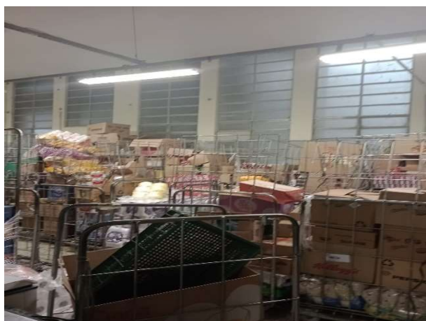
ANTES - RESERVA DESORGANIZADA COM PERDA DE ESPAÇO E VISIBILIDADE DE PRODUTOS