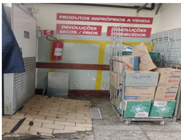
DEPOIS - ESTOQUE ORGANIZADO COM ESPAÇO E PRODUTOS VISÍVEIS