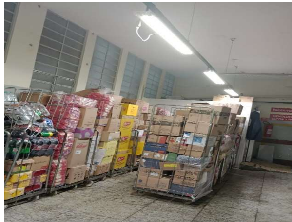
DEPOIS - ESTOQUE ORGANIZADO COM ESPAÇO E PRODUTOS VISÍVEIS