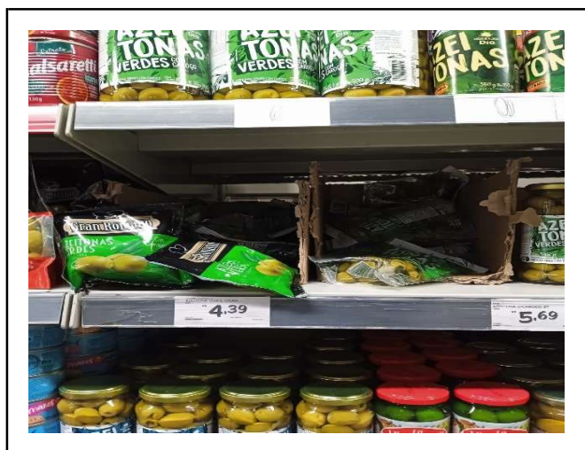
ANTES - PRATELEIRAS DESORGANIZADAS COM FALTA DE PRODUTOS DO ESTOQUE