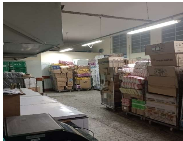
DEPOIS - ESTOQUE ORGANIZADO COM ESPAÇO E PRODUTOS VISÍVEIS