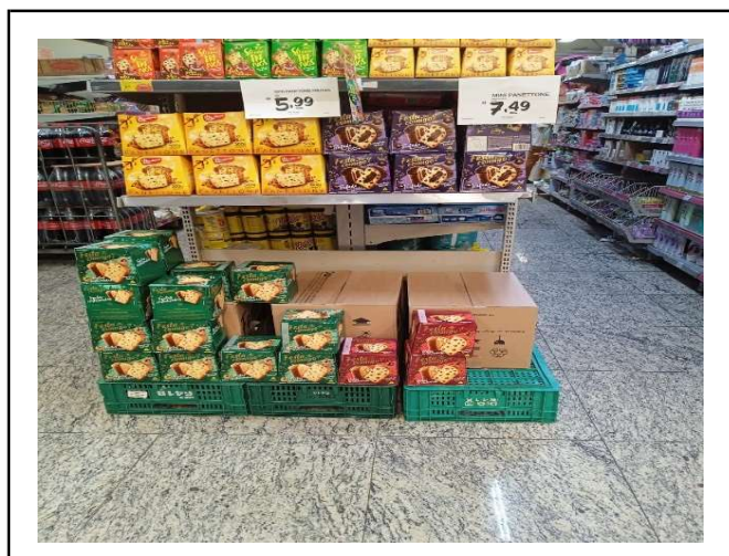
ANTES - PRATELEIRAS DESORGANIZADAS COM FALTA DE PRODUTOS DO ESTOQUE