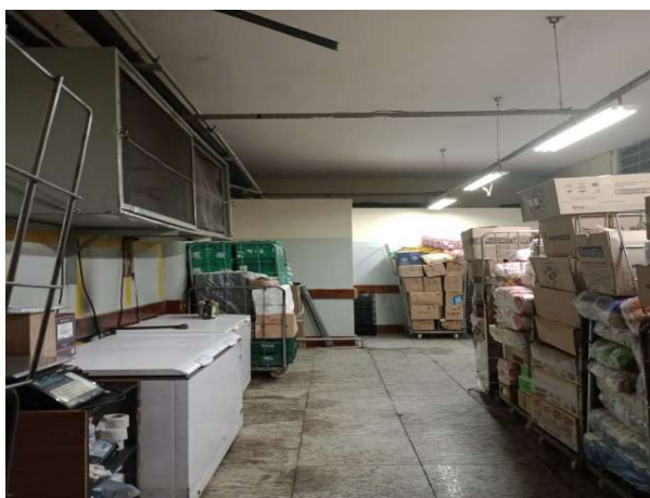
DEPOIS - ESTOQUE ORGANIZADO COM ESPAÇO E PRODUTOS VISÍVEIS