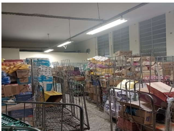
ANTES - RESERVA DESORGANIZADA COM PERDA DE ESPAÇO E VISIBILIDADE DE PRODUTOS