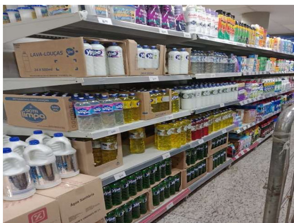
ANTES - PRATELEIRAS DESORGANIZADAS COM FALTA DE PRODUTOS DO ESTOQUE