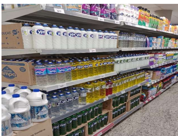
DEPOIS - PRATELEIRAS ORGANIZADAS COM PRODUTOS DO ESTOQUE