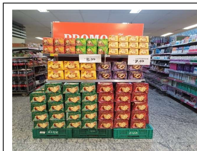
DEPOIS - PRATELEIRAS ORGANIZADAS COM PRODUTOS DO ESTOQUE